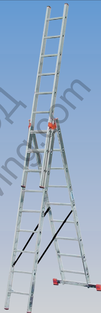
Арт. №. 120601